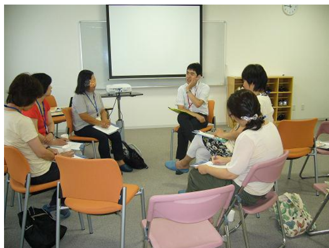
小グループでの話し合いの様子